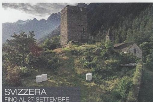
SVIZZERA FINO AL 27 SETTEMBRE

Centre d'art La Malmaison Kehinde Wiley, pittore epico ; kehindewiley.com