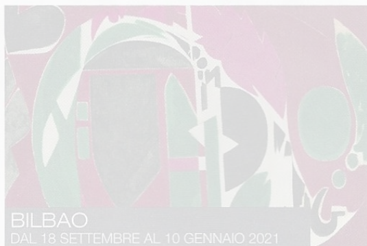
BILBAO DAL 18 SETTEMBRE AL 10 GENNAIO 2021

Tiroler Landesmuseum Il viaggio italiano di Goethe ; www.tiroler-landesmuseum.at