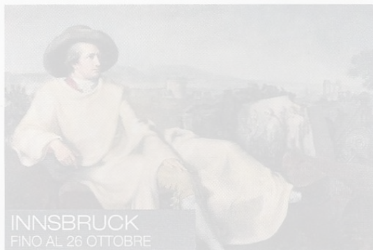
INNSBRUCK FINO AL 26 OTTOBRE

Le altre esposizioni da non perdere questo mese in Europa. Tra capolavori antichi e moderni